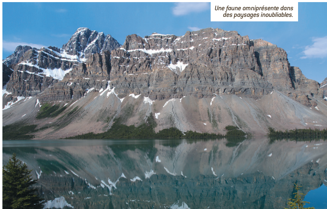
Une faune omniprésente dans des paysages inoubliables.

un terrain de jeux idéal pour les amoureux des grands espaces. La chèvre de montagne, le wapiti et son cousin le cerf de virginie se laisseront observer sans trop de difficulté, les premières se délectant du sel déposé sur les routes, et les derniers se laissant pousser par leur curiosité jusque dans les rues de Banff, Jasper ou Lake Louise. Plus de 280 espèces d'oiseaux ont également élu domicile dans ces parcs, dont plusieurs variétés de rapaces.