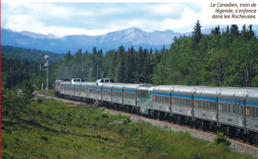
Le Canadien, train de légende, s'enfonce dans les Rocheuses.

centre et de l'ouest du Canada en 4 jours de trajet. Bien entendu, ce qui donne un caractère exceptionnel au Canadien, c'est tout d'abord la beauté des paysages qu'il tra-