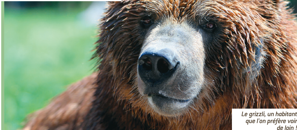
Le grizzli, un habitant que l'on préfère voir de loin !

monton, capitale de l'Alberta, que le voyage devient véritablement extraordinaire. Vous pénétrez dans les Rocheuses canadiennes, pour plonger dans les forêts à perte de vue et les lacs aux eaux turquoise dont l'image ne vous quittera plus. Après avoir traversé les Rocheuses, en passant par Jasper et son parc national, parmi les plus spectaculaires du pays, le Canadien emprunte la vallée de la rivière Fraser, berceau de la mythique ruée vers l'or, pour rejoindre Vancouver et la côte atlantique.