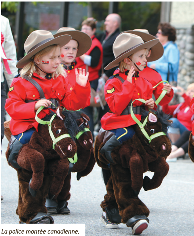
La police montée canadienne, symbole pour petits et grands.

Cette année, le festival est programmé du 6 au 15 juillet. Les places sont en ventes depuis plusieurs semaines, et nul doute que le centenaire attirera encore plus de visiteurs qu'à l'accoutumée. N'attendez pas pour réserver votre billet et surtout votre hôtel, la plupart sont pris d'assaut des mois avant le début du festival.