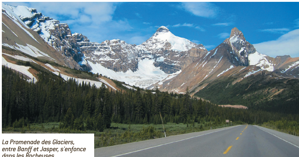
La Promenade des Glaciers, entre Banff et Jasper, s'enfonce dans les Rocheuses.

« W est wasn't won with salad ! » L'Ouest n'a pas été conquis par des mangeurs de salade. La phrase, slogan du Ranchman's, l'un des restaurants les plus fréquentés de Calgary, installe l'ambiance. Vous êtes chez les mangeurs de viande, les amateurs de barbecue, les cowboys... Bref, vous êtes dans l'Ouest sauvage. Le Stetson et les bottes sont portés fièrement, et l'attraction du coin est un concours de rodéo annuel d'un retentissement international (voir notre encadré sur le Stampede). Comme dans le sud-ouest des États-Unis, le développement de la région s'est lar-